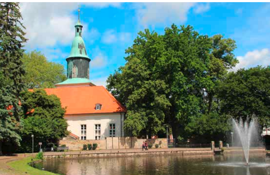
Die Michaeliskirche im Schlosspark von Fallersleben

Urlaub daheim ist zu langweilig? Wer Staycation macht, liegt voll im Trend – nicht nur in Zeiten von Corona. Jetzt wissen wir unser Zuhause noch mehr zu schätzen. Die besten Tipps für erholsame Ferien vor der Haustür.