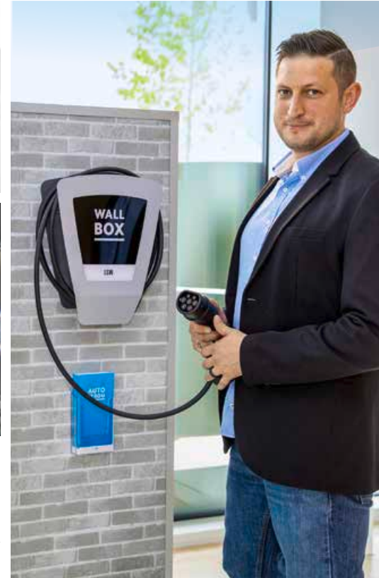
Mit den Wallboxen – etwa von der LSW – können E-Auto-Fahrer zu Hause die Fahrzeugakkus aufladen.