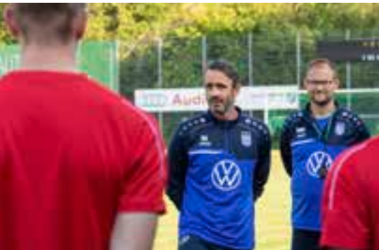
Auf den Plätzen des Lupu Stadio trainieren vier Herren- und 14 Jugendmannschaften.