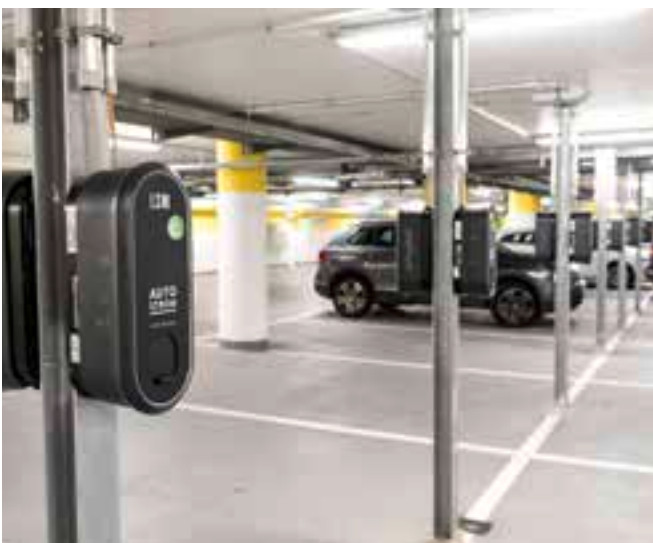
Oben: LSW-Mitarbeiter Peter Dietz an einer der vielen Ladesäulen in der Region. Unten: In der Tiefgarage des Wolfsburger Rathauses gibt es 55 Ladepunkte.

Die LSW betreibt in ihrem Versorgungsgebiet immer mehr Ladesäulen: Seit Anfang 2020 sind 109 Ladepunkte hinzugekommen, bis Ende 2021 sollen etwa 80 weitere folgen. Zum jetzigen Zeitpunkt betreibt die LSW rund 160 Ladepunkte. Die Möglichkeiten aufzutanken sind flexibel: Selbstverständlich gibt es hier für Autostrom-Kunden LSW AUTOSTROM, akzeptiert werden aber auch Ladekarten aller gängigen Anbieter. Wer überhaupt keinen Vertrag hat, kann sein E-Mobil ebenfalls mit Strom füttern: auf kurzem Weg via Direct Payment.