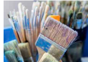
Bild oben: Bei der Sommerakademie erlernen ambitionierte Freizeit-Künstler eine Woche lang neue Techniken und Stile. Bild unten: Breite und schmale Pinsel zur Auswahl – alles was das Künstlerherz begehrt.