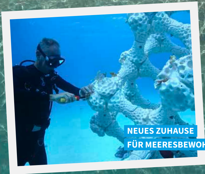
NEUES ZUHAUSE FÜR MEERESBEWOHNER

Korallenriffe, Prothesen, selbst Gebäude lassen sich mit 3-D-Druckern inzwischen herstellen. Das ungewöhnliche Verfahren spart Ressourcen, beschleunigt Bauprozesse und rettet manchmal Leben.